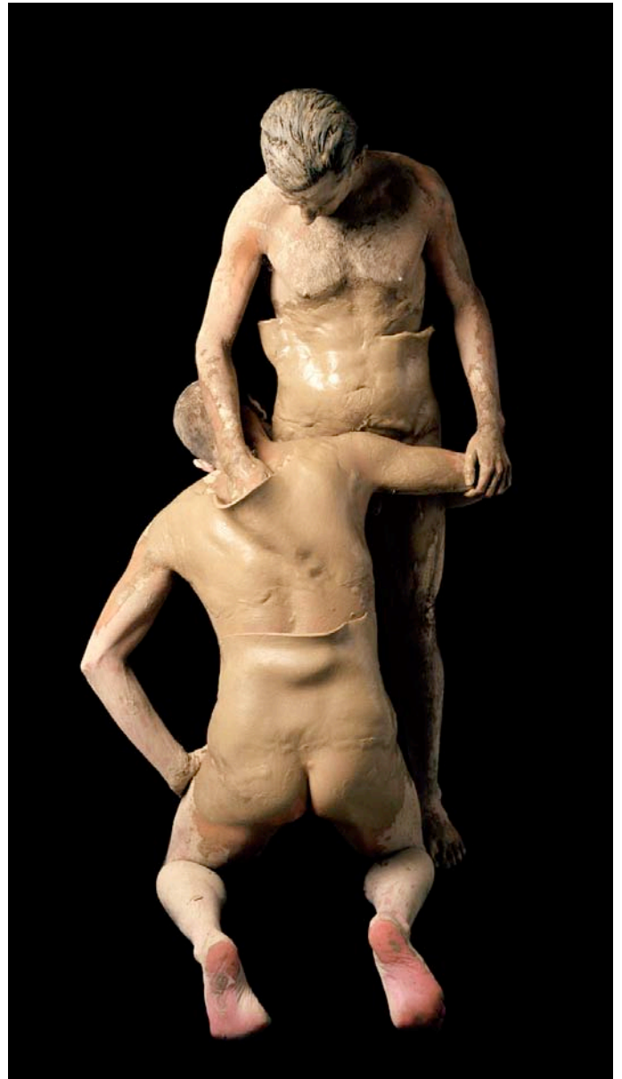
Funda de cuero , 2001 Fotografía color 165x92 cm. Edición de 3 copias. Copia 3 de 3 4.000 € + IVA